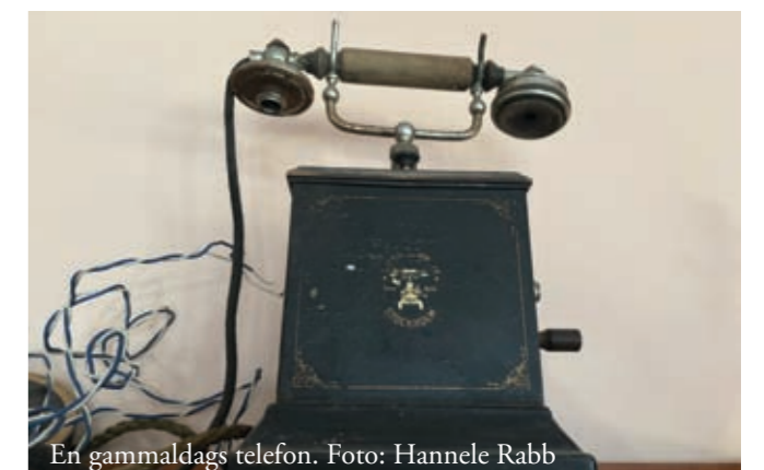
En gammaldags telefon.

Saken var klar på 2 minuter. Det var första gången jag ljög för att få en enkel sak fixad. Att döva inte kan göra så med tolk är skamlöst!!