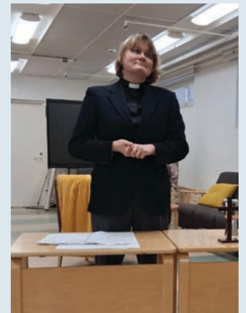
Foto från ett helt annat tillfälle: Andakt i Äppelbacken i Borgå 26.3.