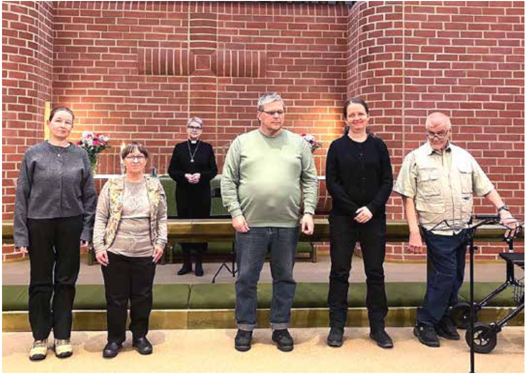
Tampereen kuurojen seurakuntaneuvoston jäsenet yhteiskuvassa.