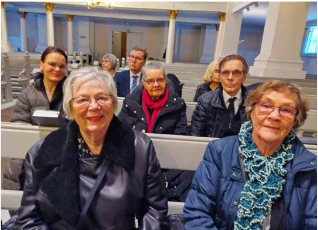
Saattoväkeä Lean hautajaisissa.