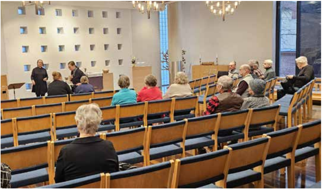
Uusi messupaikkamme on Turun ruotsinkielisen seurakunnan tiloissa Aureliassa, osoite Aurakatu 18. Valoisa ja esteetön paikka torin vieressä.