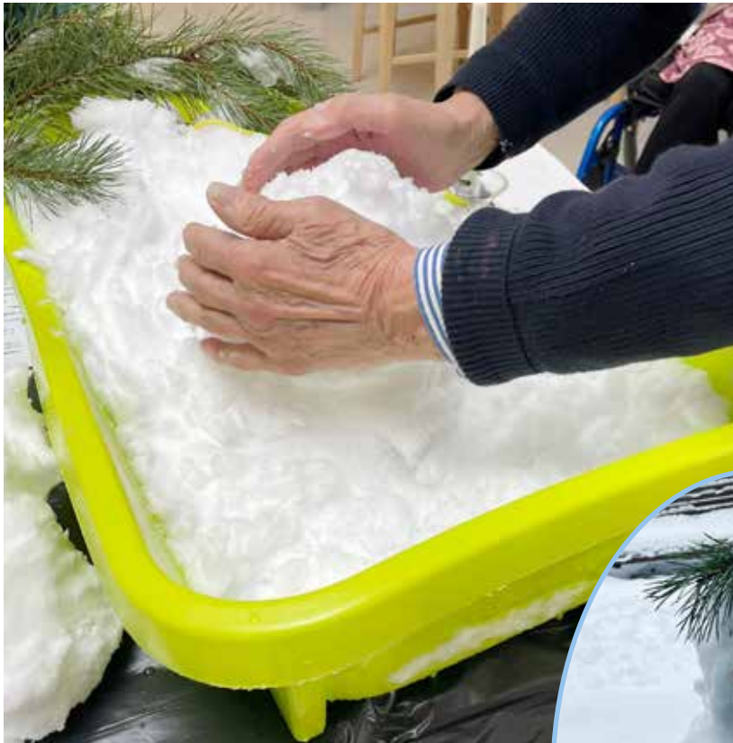
Pulkalla tuotiin lunta sisälle.

Helmikuun vierailulla palvelukoti Salmelassa tuotiin lunta tupaan: pulkan lumesta oli kiva tehdä yhdessä lumiukko. Se vietiin sitten lopulta ulkoilemaan pihalle.