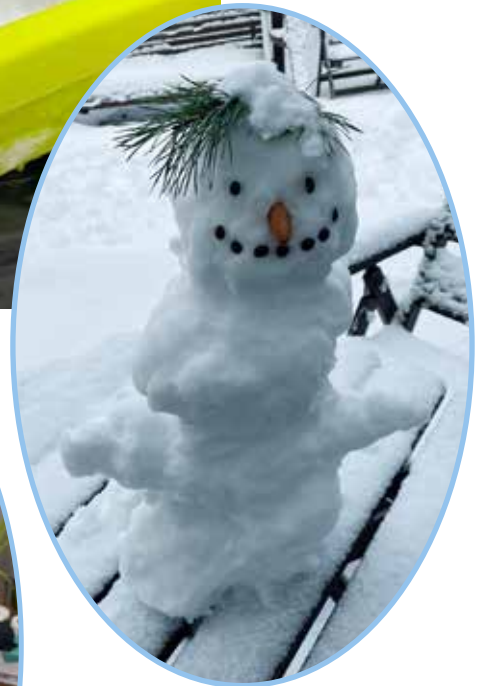
Ukko vietiin lopuksi ulos viihtymään.