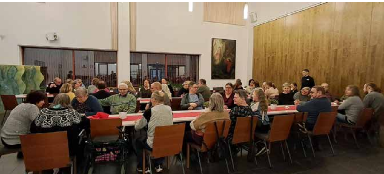
Viittomakieliset kokoontuivat Joensuun seurakuntatalolla