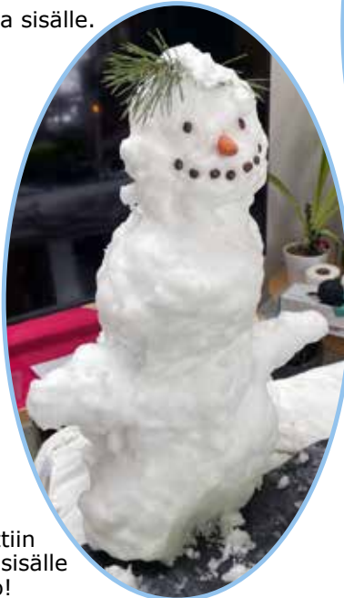
Lumesta rakennettiin yhdessä sisälle lumiukko!