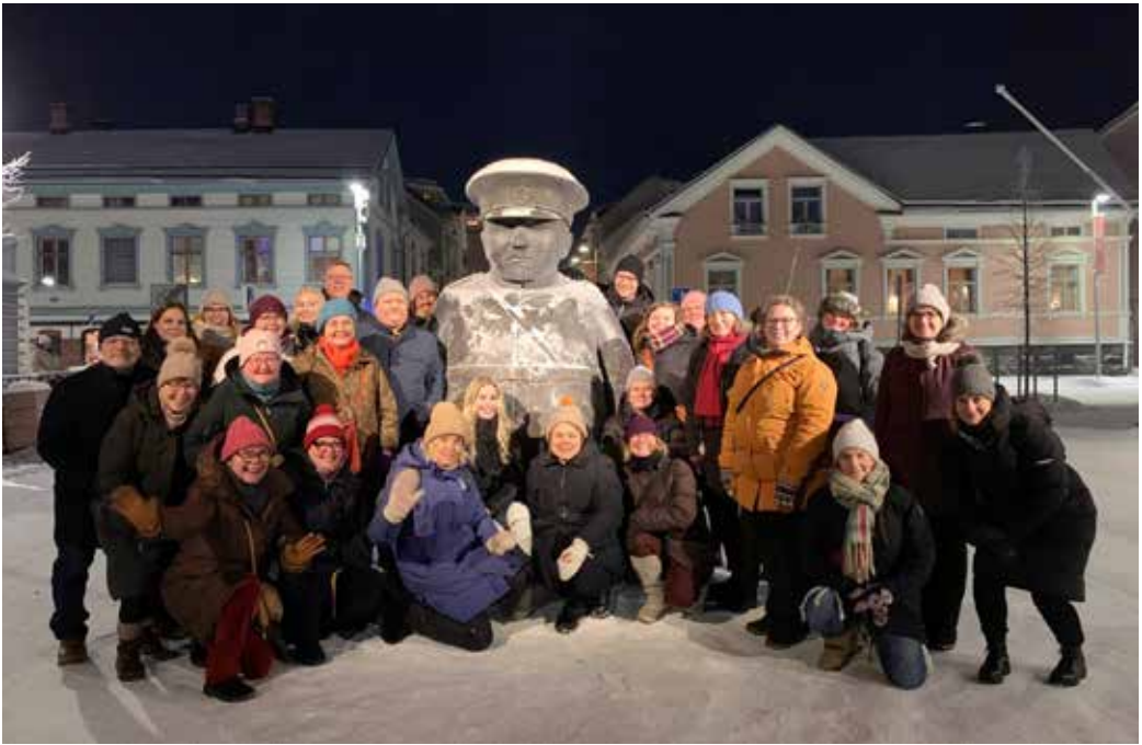
Toripolliisi ja viittomakielisen työn työntekijöitä Oulun torilla.