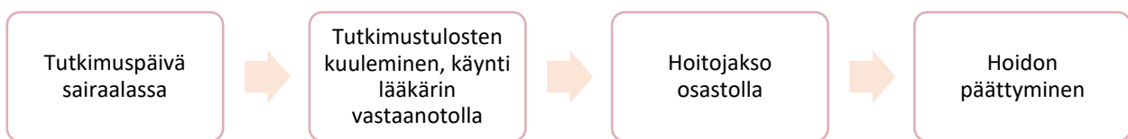
Kuvio 1. Kirkon sairaalasielunhoito osana potilaan kokonaisvaltaista hoitoa

Potilas ja läheiset voivat tavata sairaalapapin potilaan hoitopolun eri vaiheissa. He voivat itse ottaa yhteyttä sairaalapappiin tai hoitotyöntekijä tai lääkäri voi potilaan pyynnöstä kutsua sairaalapapin potilaan tai läheisen luo. Erikseen sovittaessa sairaalapappi tekee myös kotikäyntejä.