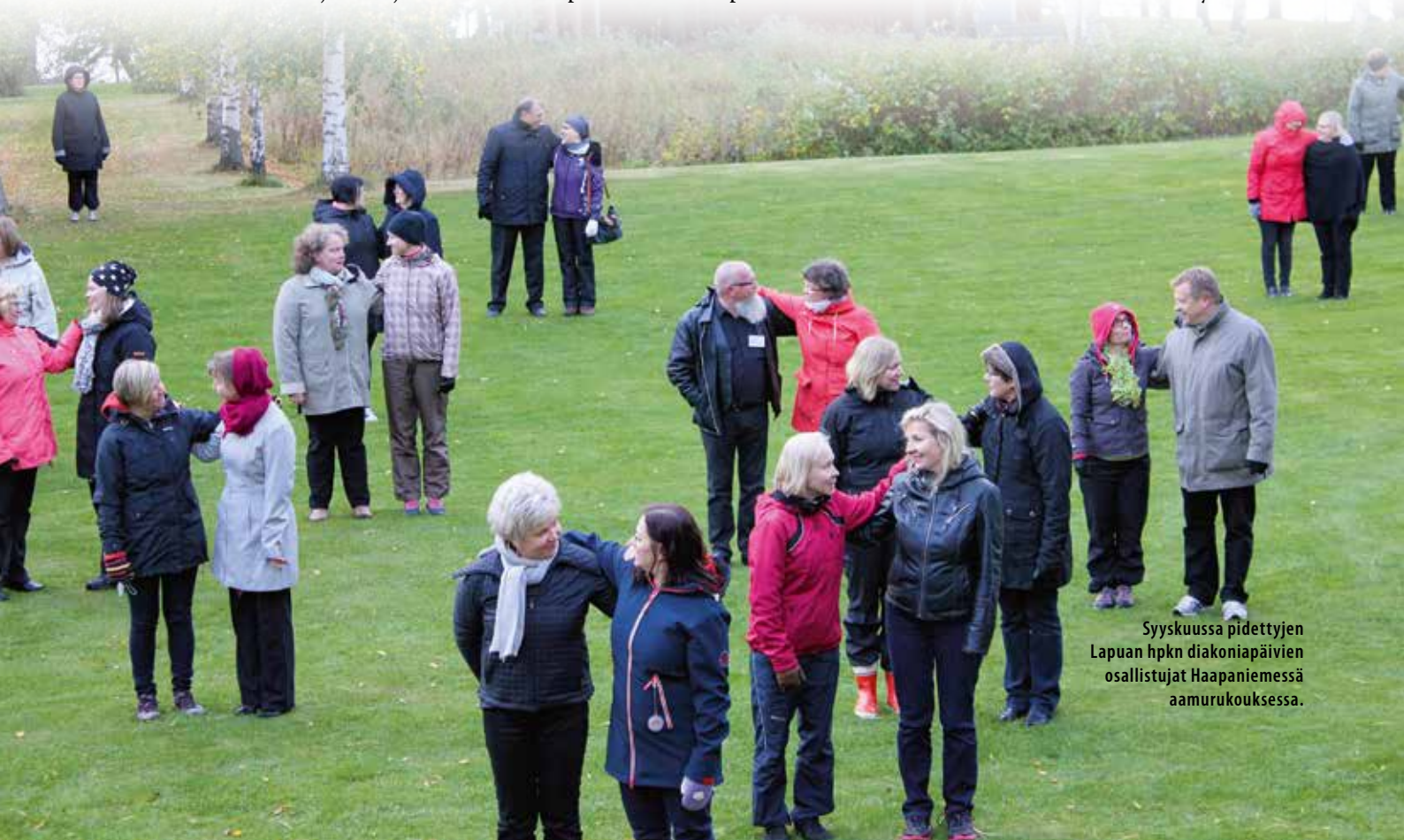
Syyskuussa pidettyjen Lapuan hpkn diakoniapäivien osallistujat Haapaniemessä aamurukouksessa.