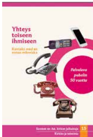
YHTEYS TOISEEN IHMISEEN – KONTAKT MED EN ANNAN MÄNNISKA SUOMEN EV.-LUT. KIRKON JULKAISUJA, KIRKKO JA TOIMINTA, 15, 2014

Palveleva puhelin täytti 50 vuotta syksyllä 2014. Yhteys toiseen ihmiseen – Kontakt med en annan människa on osana merkkipuotta julkaistu Palvelevan puhelimen juhla-kirja.