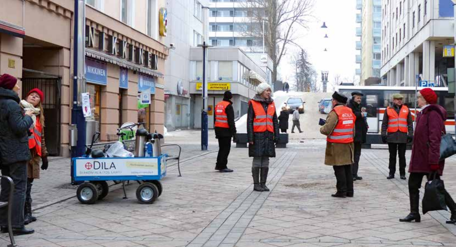
Dilan Arvo-kärry – tuttu näky Lahden keskustassa.