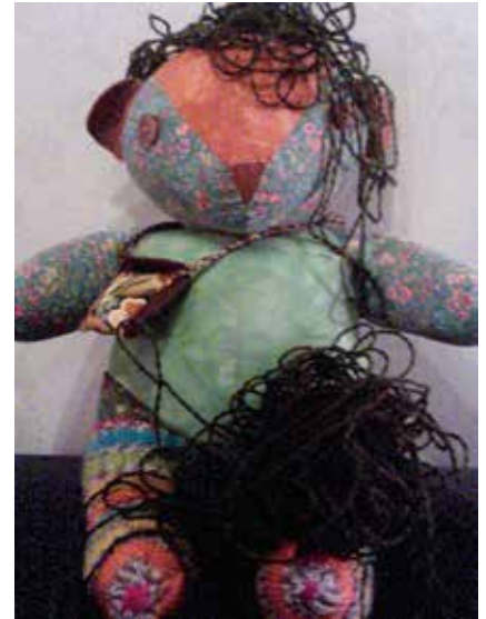
Tarinoiden maan Viisas kettu kertoo ryhmäläisille, kuinka nallen kokemat tunnettaakat tuntuvat kehossa sykkyröinä.

Tampereen Ohjaus- ja toimintakeskus Messissä on kehitetty Tarinoi-