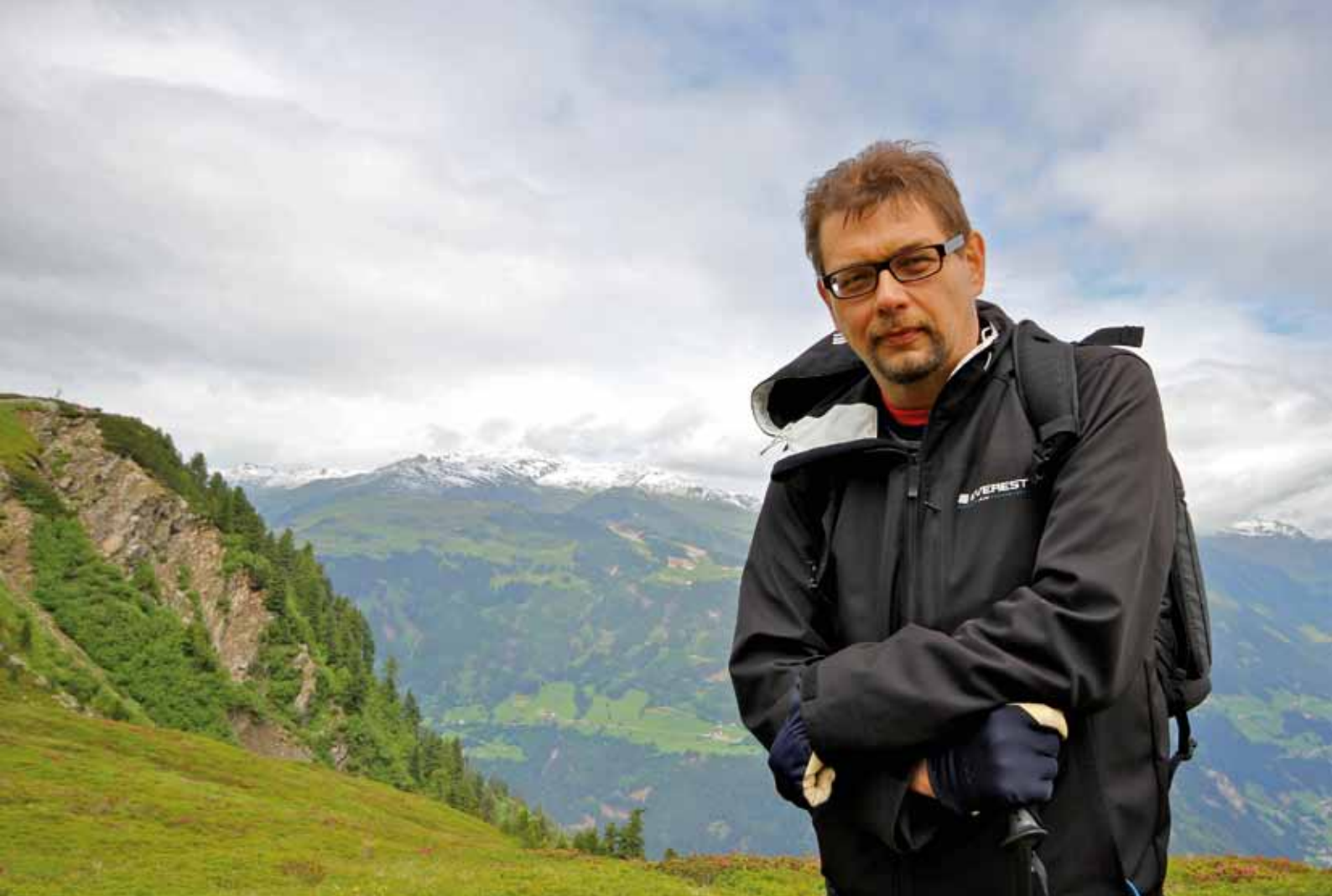
IPad kulkee Kinasen matkassa vuorillakin matkailubloggailua varten ( http://sozopol2011.blogspot.com ).