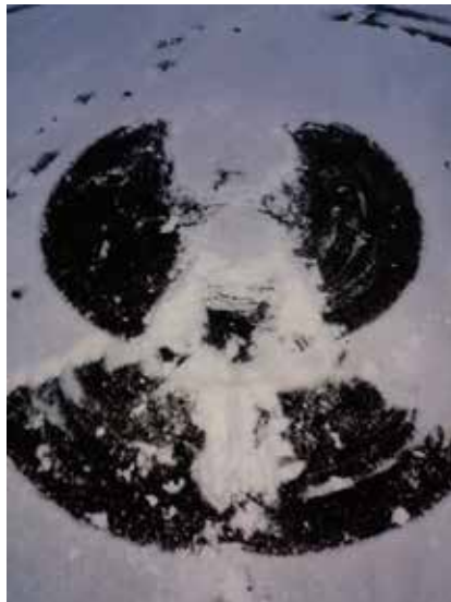
Lumienkeli; jokainen kohtaaminen, kohtaamamme ihminen, jättää meihin jäljen. Diakonina ja ihmisenä haluan jättää toivon ja välittämisen jäljen.

Perheiden taloudelliset ongelmat ovat lisääntyneet, joten Oulunkylässä myös tukikummiavustustyö on lisään-