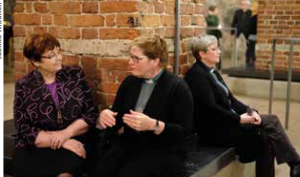
Juhlavieraat kävivät monia mielenkiintoisia keskusteluja ja muistelivat menneitäkin.