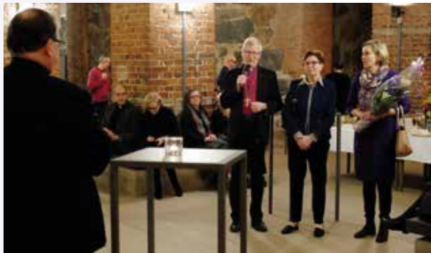
Tukikummit-säätiö toi tervehdyksensä piispa Seppo Häkkinen johdolla.