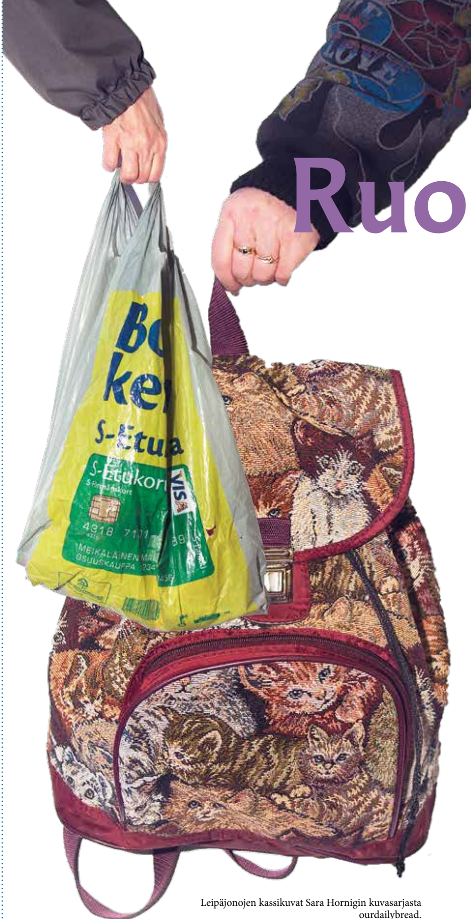
Leipäjonon kassikuvat Sara Hornigin kuvasarjasta ourdailybread.