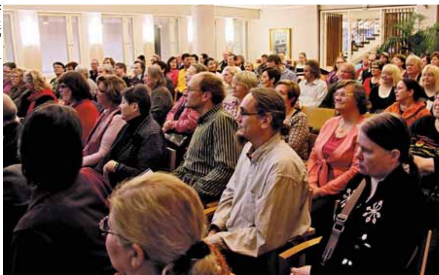
Tampereen sinkkutoiminnan kymppijuhlien osallistujia 17.11.2012. Juhliin osallistui sinkkuja myös Turusta, Jyväskylästä, Seinäjoelta ja Espoosta.

jektiivinen oikeus ja seurakunnan velvollisuus on täyttää tämä toive kaikille ikäryhmille. Erityisen kiinnostavaa on ollut se, että myös yli 65-vuotiailla on suurta ennakkoluulotonta kiinnostusta näinkin erikoista seurakunnan toimintaa kohtaan.