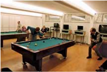
Nekalan oloiloissa voidaan pelata sisäpelejä, saunoa ja syödä yhdessä.