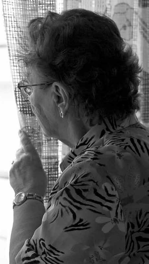
Ossi Gustafsson / Suomen vanhusten turvakotiyhdistys ry

Suomen vanhusten turvakotiyhdistyksen auttavaan puhelimeen SUVANTO-linjalle soittaa keski-ikäinen mies. Hän epäröi, tuliko soittaneeksi oikeaan numeroon. Hän hakee vahvistusta epäilylleen ja huolelleen. Soittajan isä on 78-vuotias. Hän asuu kotitilalla lähes kaksikymmentä vuotta nuoremman naisystävänsä kanssa. Poika muistelee isänsä vuosien varsilta kertoneen yhteiselämän sujuneen vaihtelevasti. Isä ei tyypillisenä suomalaisena miehenä ole koskaan liiemmästi omista asioistaan puhunut. Viime vierailulla isä oli kuitenkin ollut erittäin pelokas ja ahdistunut ja kertonut, että nyt eivät asiat ole hyvin. Olihan poika jo pidemmän aikaa jotain aavistellut, mutta ei tullut kysyneeksi.