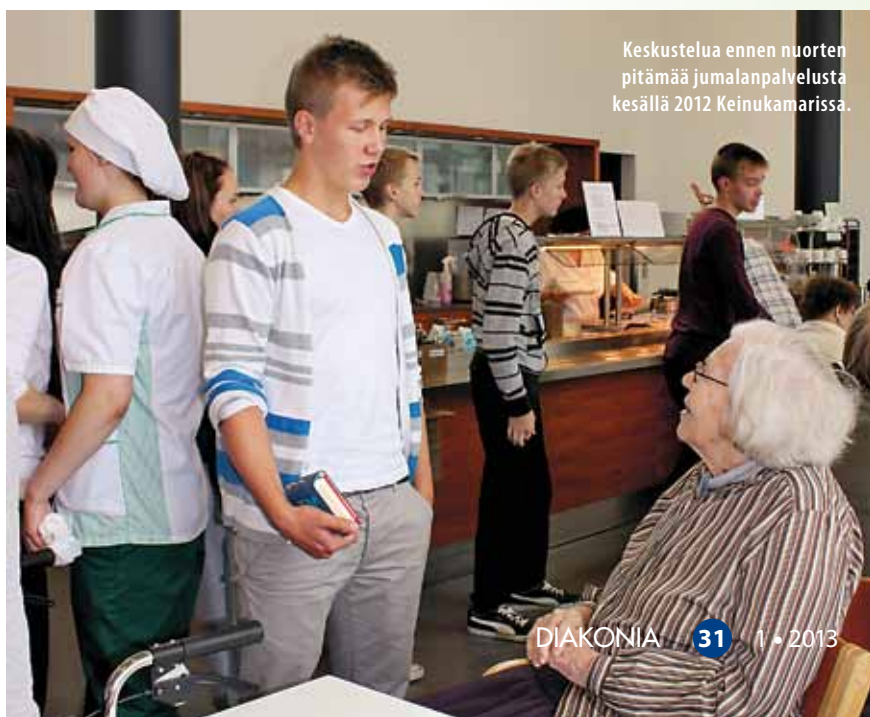
Keskustelua ennen nuorten pitämää jumalanpalvelusta kesällä 2012 Keinukamarissa.

Vanhustyön diakonissa Hämeenlinna-Vanajan seurakunta