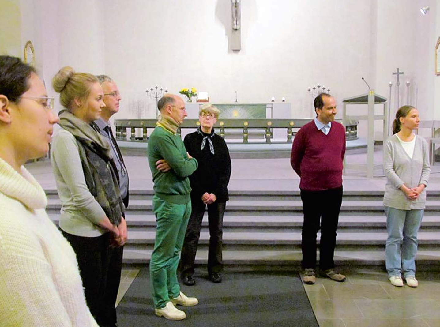
Eri uskontojen edustajia koolla Paavalin kirkossa.