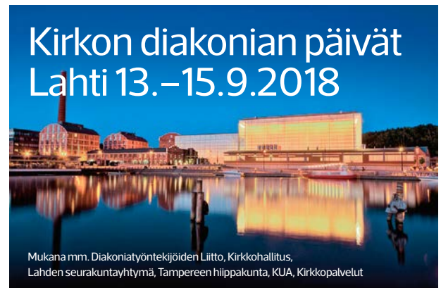
Mukana mm. Diakoniatyöntekijöiden Liitto, Kirkkohallitus, Lahden seurakuntayhtymä, Tampereen hiippakunta, KUA, Kirkkopalvelut

Osallistumismaksu on 285 euroa sisältäen osallistumisen, ateriat ja perjantain juhlapäivällisen. Luottamushenkilöille ja muille diakonian toimijoille lauantapäivän osallistumismaksu 50 euroa sisältäen ohjelman, lounaan ja kahvin. Majoitushinnat 1 HH 128–140 euroa ja 2 HH