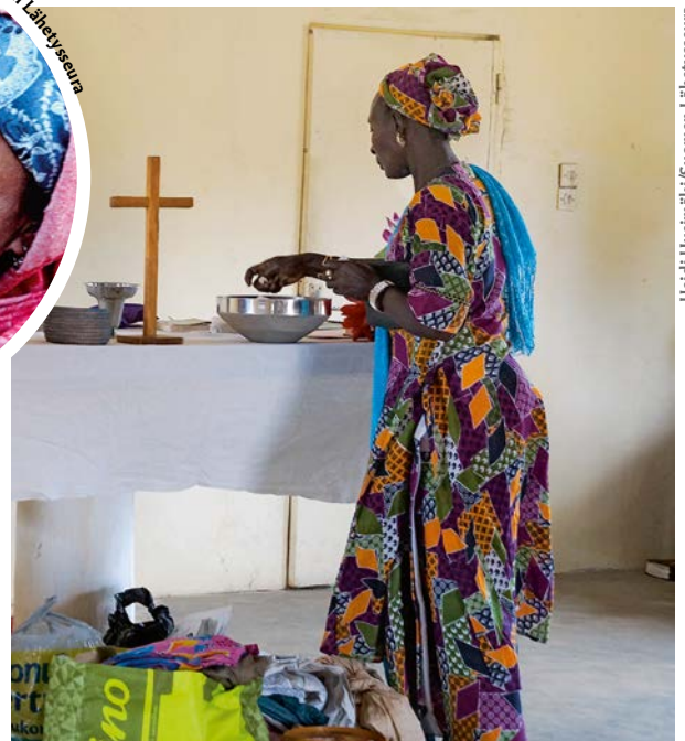
Nainen alttarin äärellä Thiadiayen seurakunnassa Senegalissa.