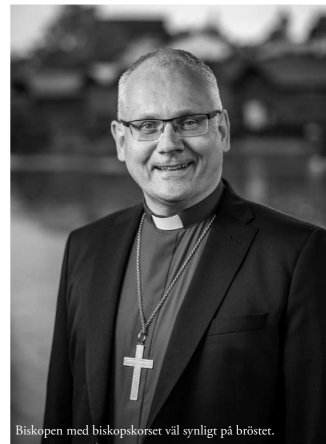
Biskopen med biskopskorset väl synligt på bröstet.