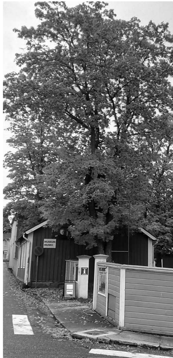
Vackra höstfärger, men här i svartvitt. Huset är rött, staketet gult och den stora lönnen är alldeles orange.

Här i Ekenäs, liksom i de flesta församlingar, är Alla helgonsdags gudstjänst en av de mest besökta gudstjänsterna. Människor samlas för att minnas dem som gått bort. Men, Alla helgons dag är faktiskt inte i sig en sorglig dag. Alla helgons dag har traditionellt två teman. Vi minns martyrer, kristna som dog för sin tro, och vi minns våra nära och kära som gått bort. Men dessa två teman hör också ihop. Alla som har gått bort och alla vi som är kvar hör till samma osynlig gemenskap genom Kristus. Hoppet om det eviga livet och tacksamheten över allt det goda som de bortgångna var och gav lyser opp sorgens och