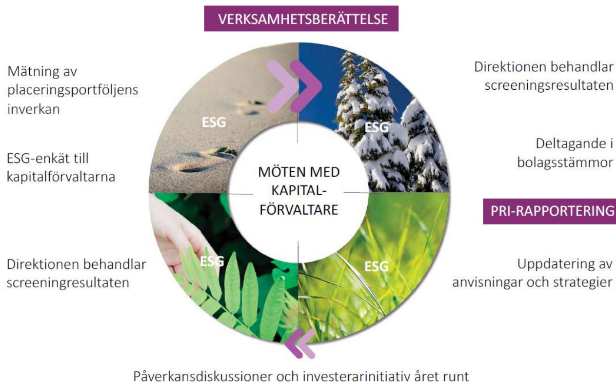
Bild: Årsklocka som beskriver pensionsfondens ansvarsfulla placeringsverksamhet och rapporteringen i anslutning till den.