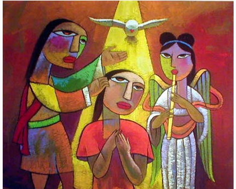
Baptism of Jesus II, Dr. He Qi (China/USA)