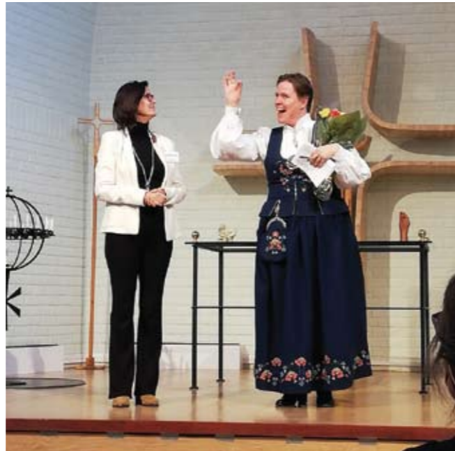
Dagen var fylld av glädje och stolthet.

Under andra världskriget var Norge ockuperat av