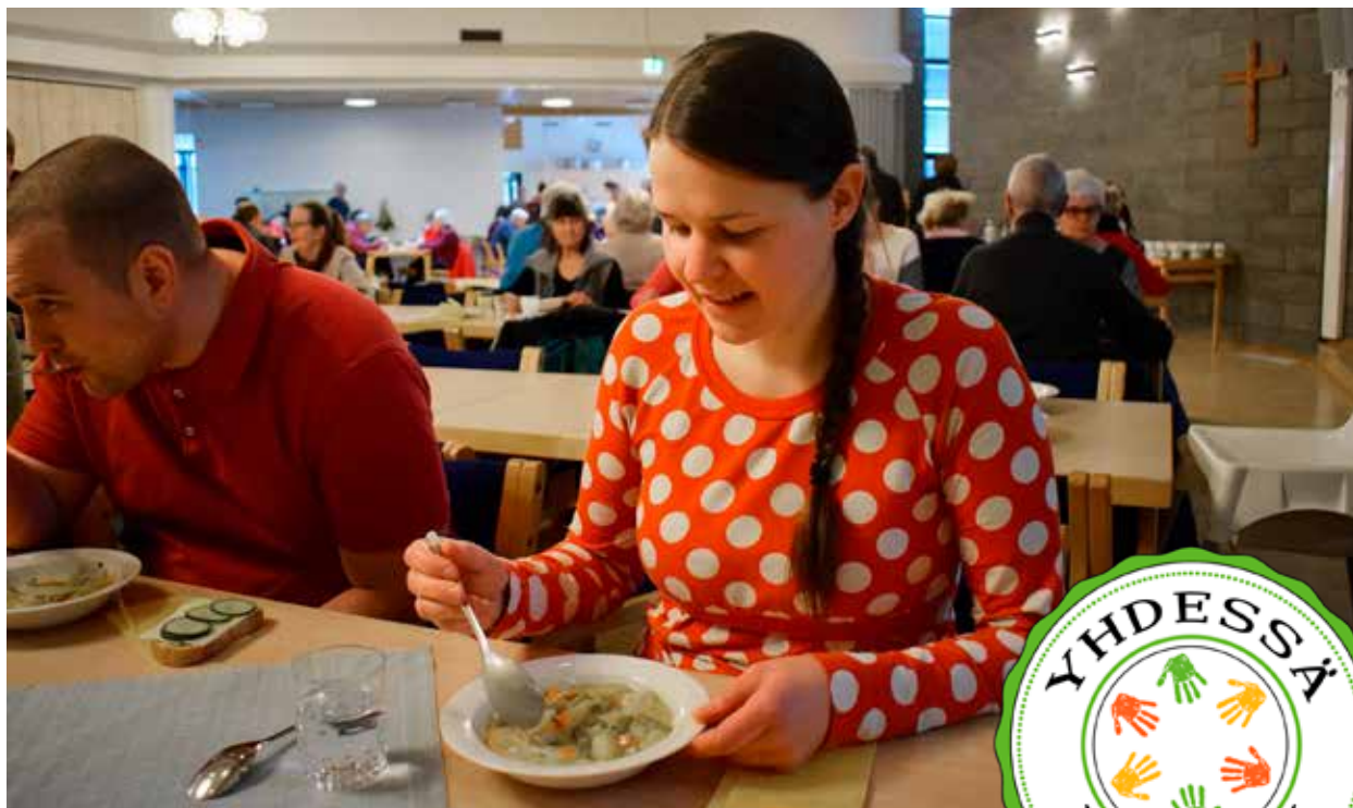
Samalla sopalla seurakuntatalolla käy kuukausittain yli 400 ruokailijaa.