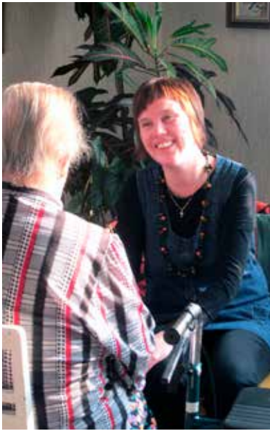
Kotikäynnillä olennaista on ajan antaminen ja kohtaaminen.

Rukous on keskeistä kotikäynti- tai laitostyössäni. Yhdessä rukoileminen tuo lohtua ehkä enemmän kuin mikään muu, samoin tutut virret. Moni muistisairas vastaanottaa vielä musiikkia, rauhoittuu ja pysähtyy käsillä olevaan hetkeen. Osa vanhuksista haluaa, että hänet siunataan tai että hän saa ehtoollisen papin tai diakoniatyöntekijän tuomana. Hoivayksiköissä asuvat vanukset ovat aikaisempaa heikkokuntoisempia. Hartaushetkissä vähennän puhetta, lisään lempeää kohtaamista, lämpöä, jutustelua, tuttuja virsiä ja hengellisiä lauluja. Niistä välittyy Jumalan rakkaus ja toivo. Tärkeää on kertoa, että Jumala kyllä vielä muistaa silloinkin, kun itse ei enää muista.