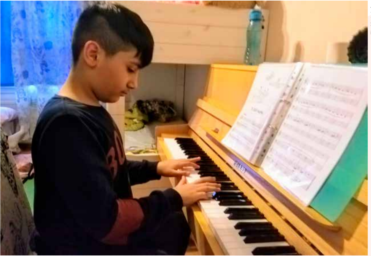
Siamendin instrumentti on piano. Soittamisesta saa keskustelunaiheita muiden luokkatovereiden kanssa, ja näin myös kielitaito kehittyi.

mään opinnot sodan alettua. Hänen äidinkielenä on kurmanzi. Suomesa sekä kurmanzin että arabian kielen osaamisesta on ollut hyötyä.