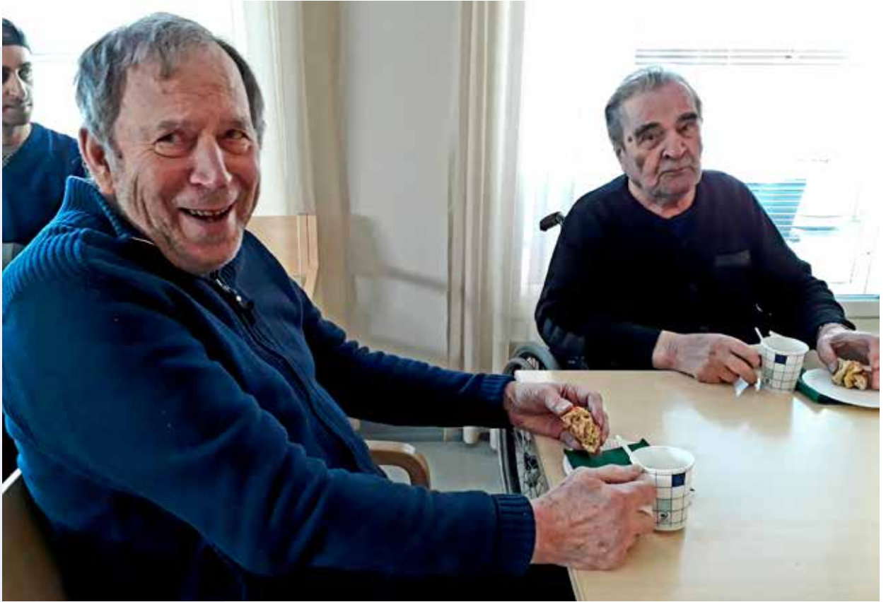
Palvelutalon kahvi ja pulla maistuvat eri-ikäisille eläkeläisille. Vuosien varrella moni on tullut jo toisilleen tutuksi.