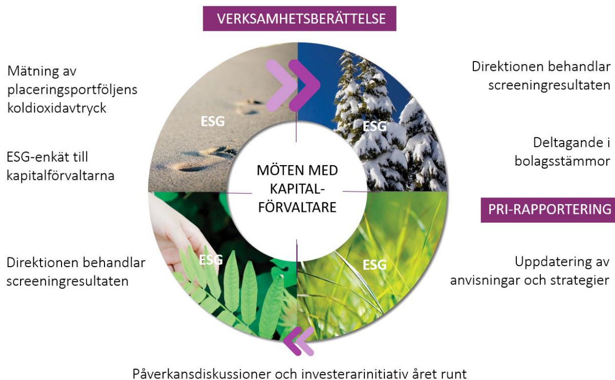
Bild: Årsklocka som beskriver pensionsfondens ansvarsfulla placeringsverksamhet och rapporteringen i anslutning till den.

Pensionsfonden vill även i fortsättningen utreda möjligheterna att inkludera ESG-poängsättning och impact-mätare i sin månads- och årsrapportering. FN:s mål för hållbar utveckling utgör en central ram för rapporteringen av impact.