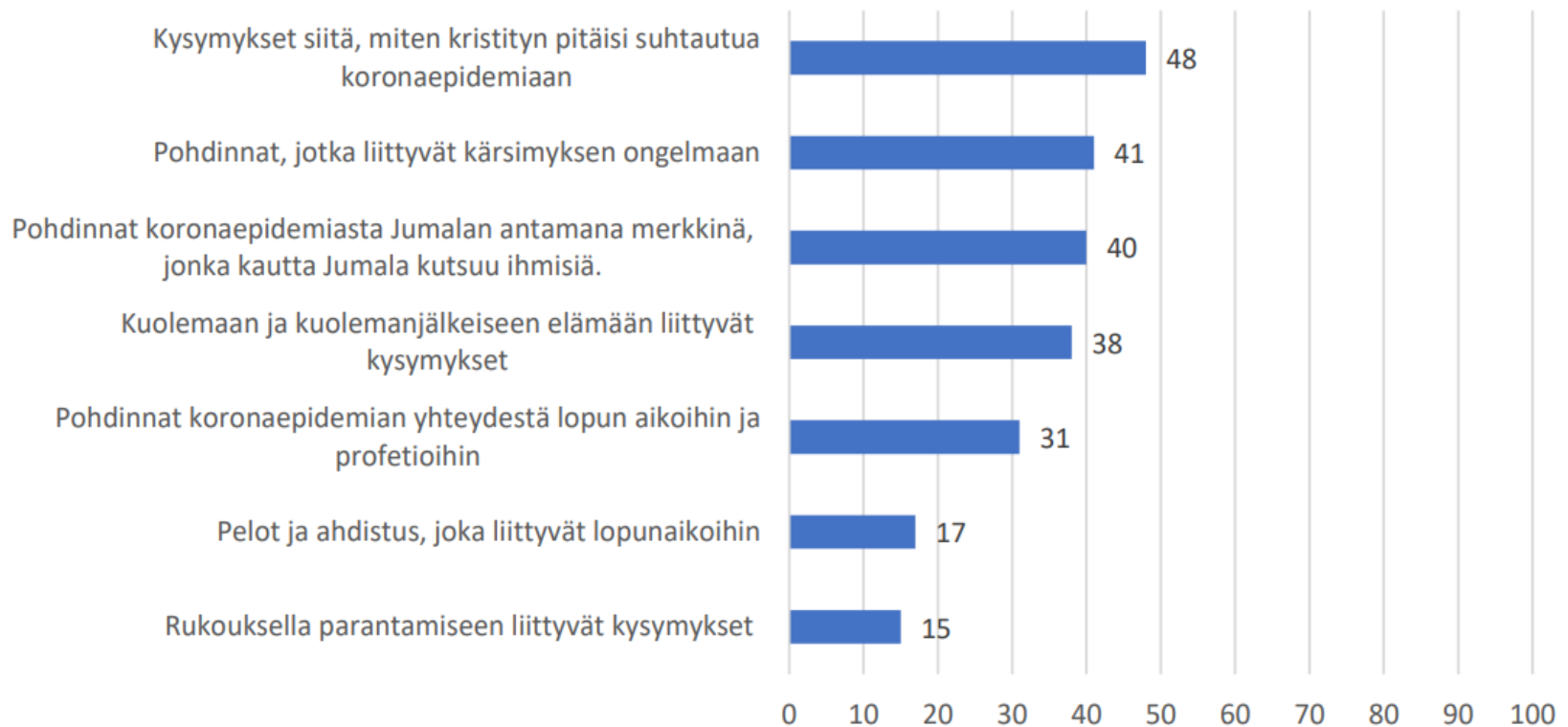
Kuvio 7. Keskusteluissa esiin tulleet uskonnolliset koronatulkinnat (%). Työntekijä- ja luottamushenkilökysely 2020, N=123.