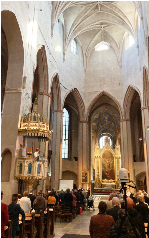
Diakonian 150-juhlavuoden syksyn ensimmäinen messu 4.9. Vietimme yhdessä diakoniatyön 150- vuotisjuhlamessua Turun tuomiokirkossa.