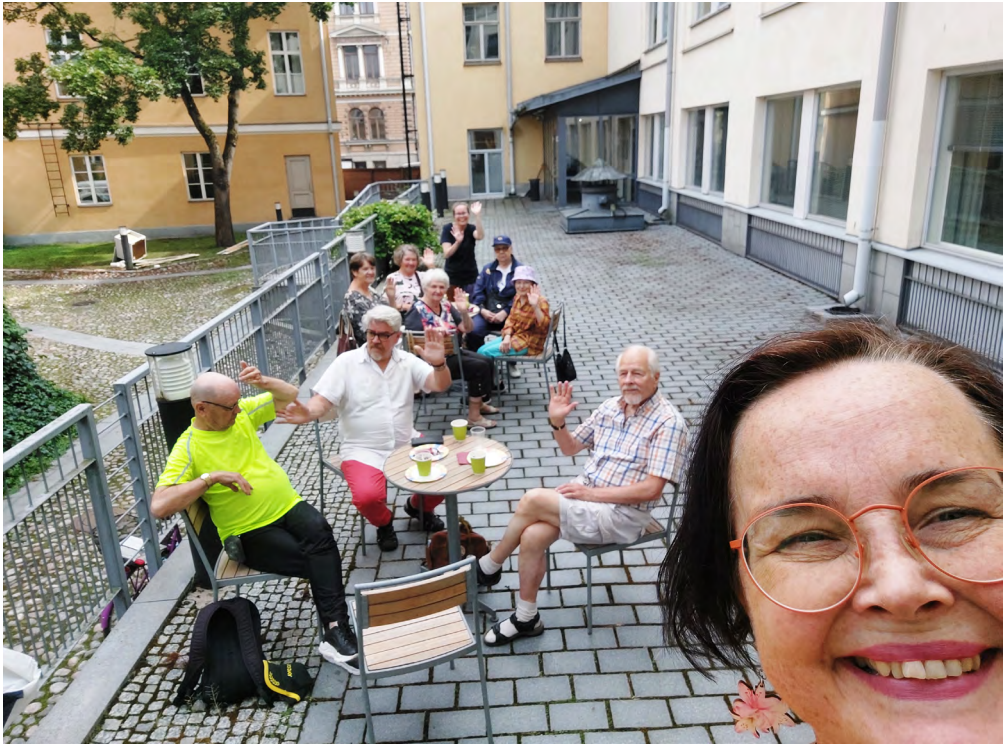
Vietimme kesäkahveja elokuussa Kapitulin sisäpihalla.