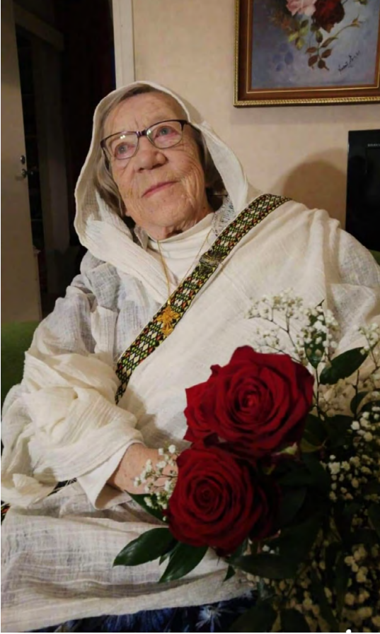
Anni puettuna etiopialaiseen pukuun